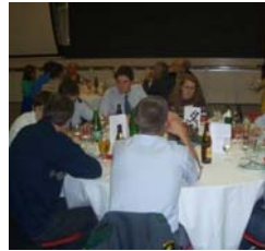
Der M20er-Tisch, alle Jahre wieder ein erstrebenswertes Ziel, an der Ehrung dabei zu sein.